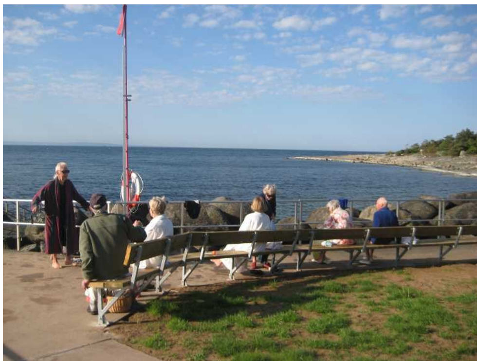
Bild från Svärjarehålan från 28/5 kl 08.07

Både Stora Stranden och Svärjarehålan har även i år fått blå flagg som tecken på god service och bra vatten.